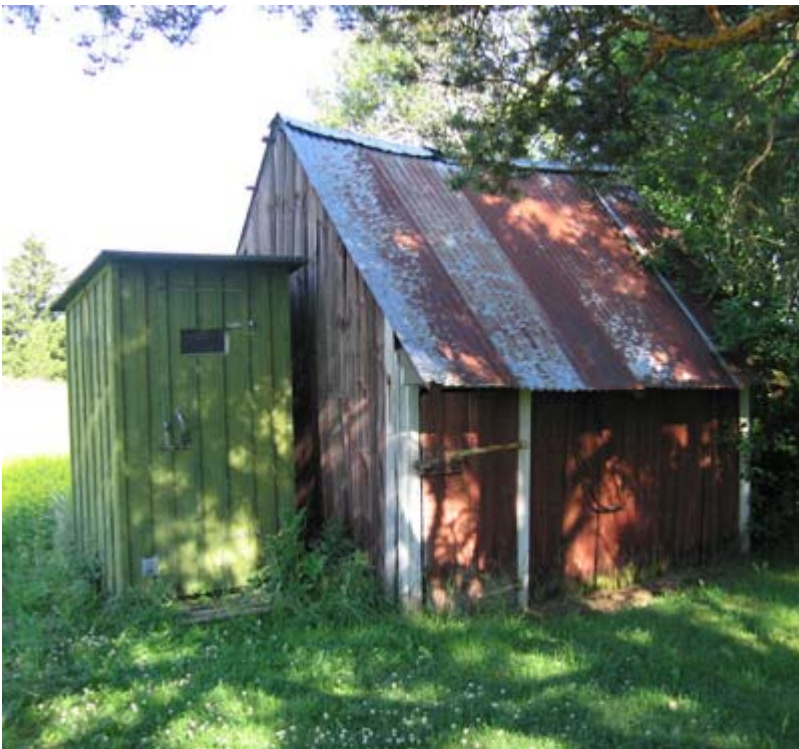
Häggtorp används idag som jaktstuga